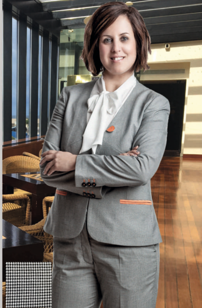
Detalhe real do tecido